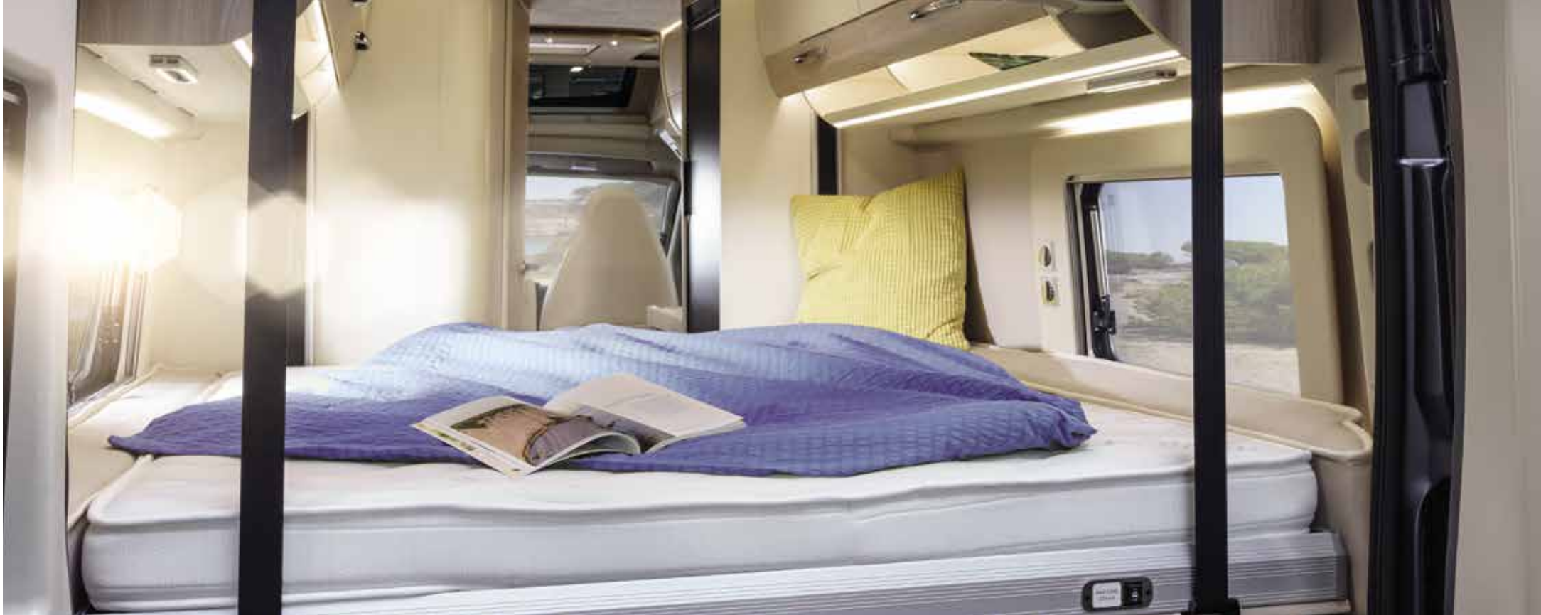
Vloerindeling: V 635 HB †

Is het nu een vrachtwagen – of toch een slaapwagen? Onder het eenvoudig via een druk op de knop te openen bed met een comfortabel ligvlak gaat een laadruimte van 1800 x 1200 x 1300 mm (lxbxh) schuil – die ruimte is zelfs geschikt voor een groot aantal motoren.