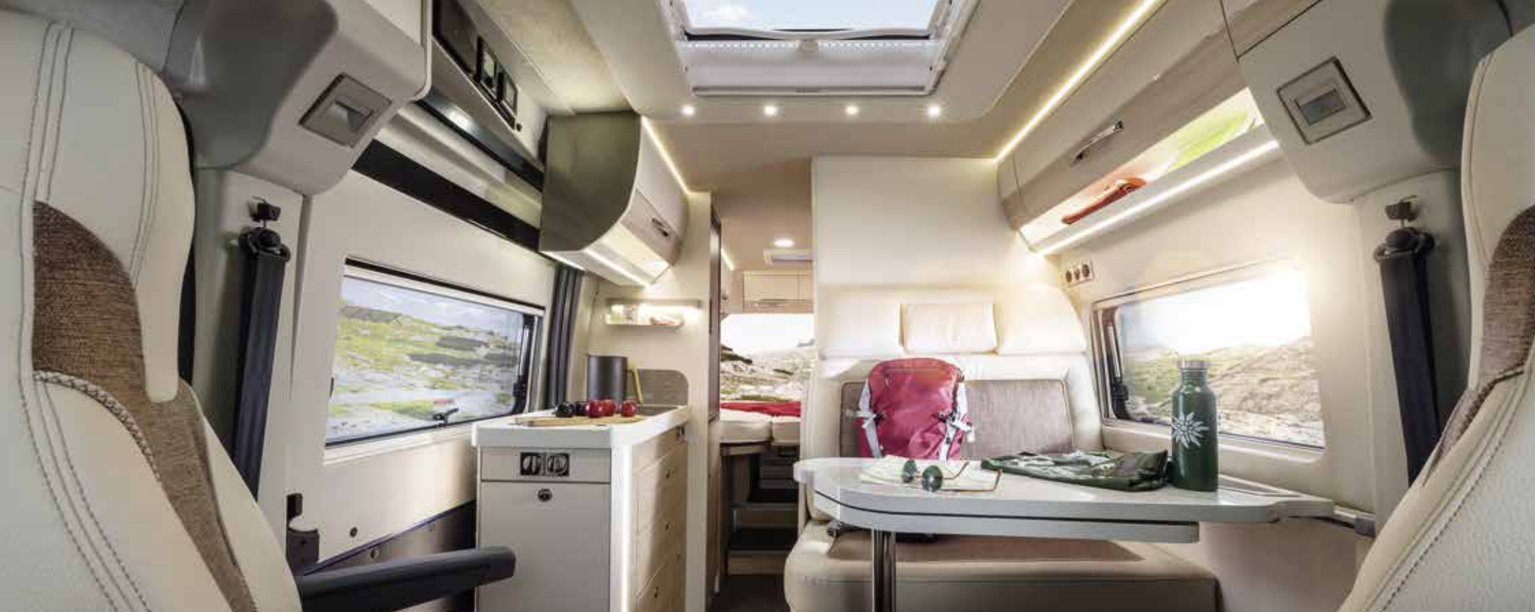
↑ Vloerindeling: V 635 EB

Ontspannen slaapcomfort op de tot wel 1,95 m lange aparte bedden en hoge opbergruimte-variabiliteit zijn de markante, individuele sterke punten van de V 635 EB. Dankzij de in een handomdraai via een knevelsluiting te verwijderen opbergboxen achterin kan de opbergruimte achter zeer flexibel worden gebruikt.