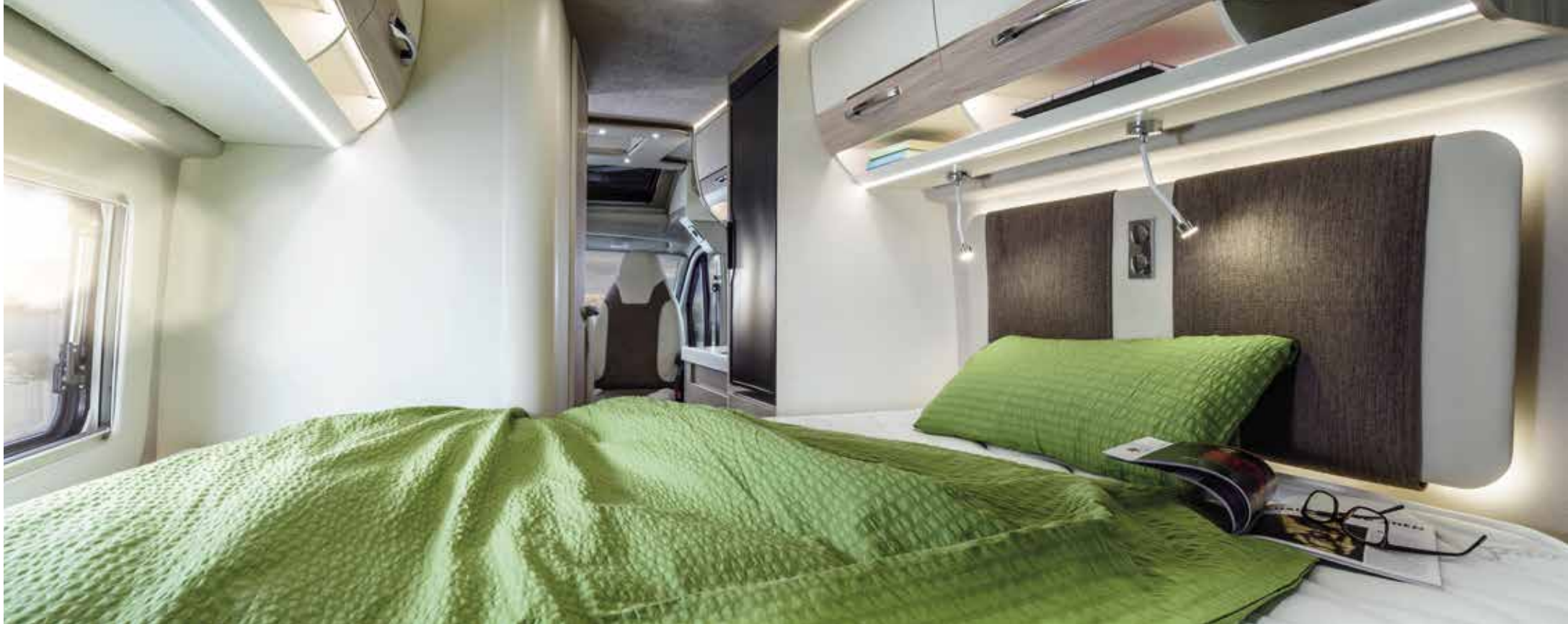
Vloerindeling: V 595 HB †

De plattegrond-klassieker voor compacte vans tot een lengte van 6 m overtuigt bij de V 595 HB met een comfortabel, van schotelveren en koudschuimmatrassen voorzien, klapbaar tweepersoons bed - inclusief zwenkbare led-leeslampjes met USB-poorten op het gestoffeerde hoofdgedeelte.