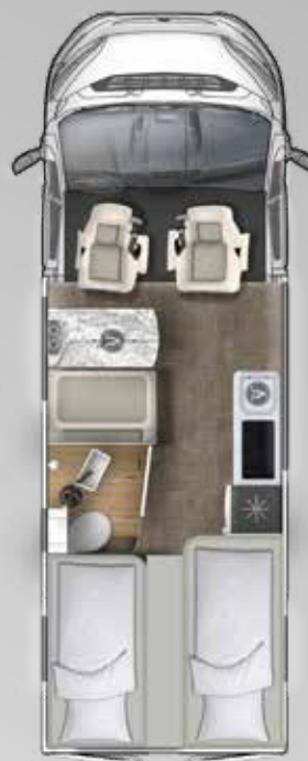
V 635 EB