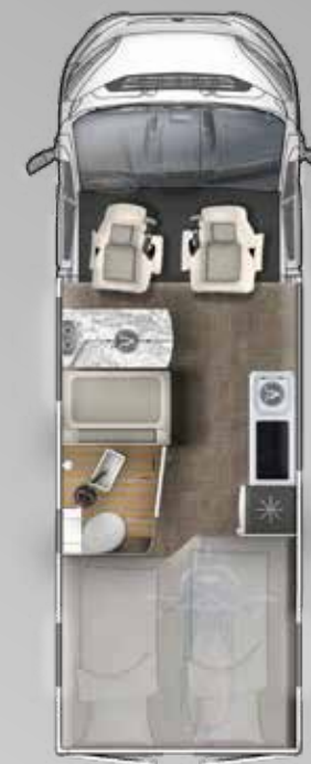
V 635 HB