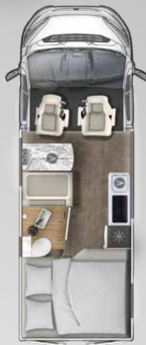
V 595 HB